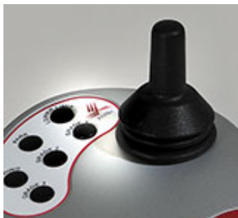
人体工学设计的操作杆: 所有的操作都可完成在你的指尖

更广泛与多样化的测试将可以实现在 Condor Sigma 量测范围可以从小于 1gf (克) 到 200kgf (公斤). 数位 (数码) 化温度变异自动修正补偿以及目前全球最高的 24bits 解析度 (分辨率) 提供了更可靠及高再现性的量测结果.