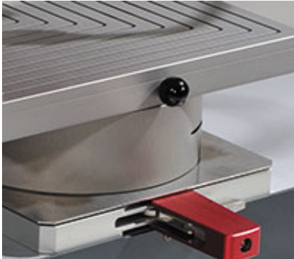
快拆接头 (面): 更换治具在数秒内完成

三轴皆为高扭力设计, 且开放式的工作台面设计, 可容纳不管多宽或多小的待测物, 省却以往还需使用特殊治具的困扰. 高精度的快拆式夹具 和测试模块可以确保快速更换测试样品和立即进入测试中.