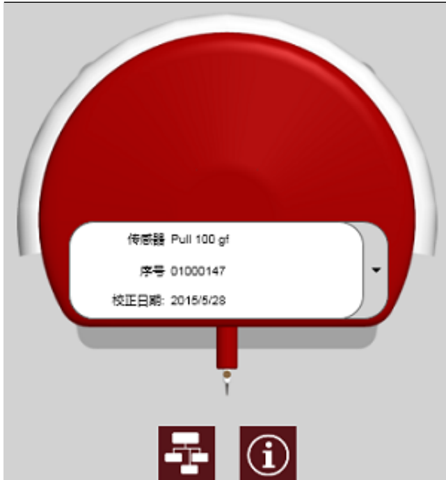
Condor Sigma 的操作软件可以说你的语言. 这是在中文版本的部分画面撷取

现有在其他厂牌的使用者将会发现,在 Condor Sigma 机台上, 你可以非常容易将现有测试流程及方式在非常短的时间转换到最新工艺的 Condor Sigma 平台上. 它的高效能无庸置疑是目前业界最好的剪切力测试机, 请不要跟我们说一样的话, 你应该有更好的形容词. 请马上亲身体会, 并马上导入产线测试生产!