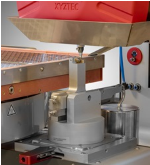
1:2 calibration jig fitted next to a large heater workholder. The customer does not need to remove the workholder in order to calibrate the bond tester

一个简单和直觉的软件精灵可以确保校正可以被轻松和准确的完成. 另外, 我们也提供我们的传感器可以透过其它测力计 (load cell) 来校正. ,另如, Chatillon 测力计. 所有任何有关校正都可以被客制化成很简单或多样化来符合你的需求.