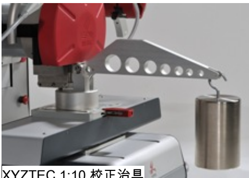
XYZTEC 1:10 校正治具

所有 XYZTEC 的传感器模块都已被完整测试及校正,随时可以使用. 每一个传感器都拥有各自的电子电路模块,可以同时储存所有测力和温度校正资料. 也可以储存其它资讯像是,传感器型号,测力范围, S/N 制造号码,等资料.