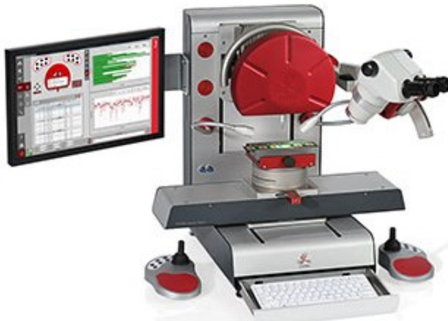
XYZTEC Condor Sigma 和 六合一旋转测量模块 RMU