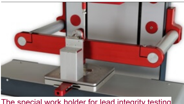
The special work holder for lead integrity testing

다른 일반적인 워크 홀더는 특히, 리드프레임 제품을 위해 디자인된 customize 된 마스크와 inlay입니다. XYZTEC은 또한 대상을 깔끔하게 가열할 수 있는 디자인과 PID 온도 조절기 그리고 히팅 블록을 제공 합니다. 이것은 500도까지 쉽게 가열 가능하고 다양하게 customized된 inlays에 장착 가능 합니다.