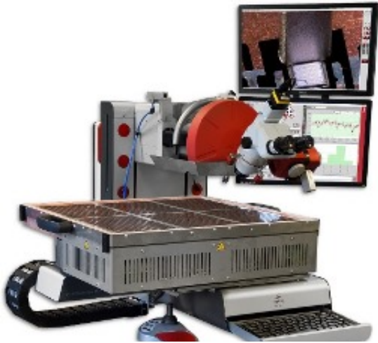
The market leading Condor Sigma W12, equipped with a rotating 13500W 518x513mm heater stage

다른 일반적인 워크 홀더는 특히, 리드프레임 제품을 위해 디자인된 customize 된 마스크와 inlay입니다. XYZTEC은 또한 대상을 깔끔하게 가열할 수 있는 디자인과 PID 온도 조절기 그리고 히팅 블록을 제공 합니다. 이것은 500도까지 쉽게 가열 가능하고 다양하게 customized된 inlays에 장착 가능 합니다.