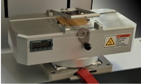
Heater workholder (up to 500°C) mounted on the Sigma by quick release system

신뢰성을 얻기 위해, 반복 가능한 측정은 Condor 장비보다 정밀한 것들을 필요로 합니다. 이러한 중요성은 Condor 장비를 통해 테스트 동안 제공될 수 있습니다.