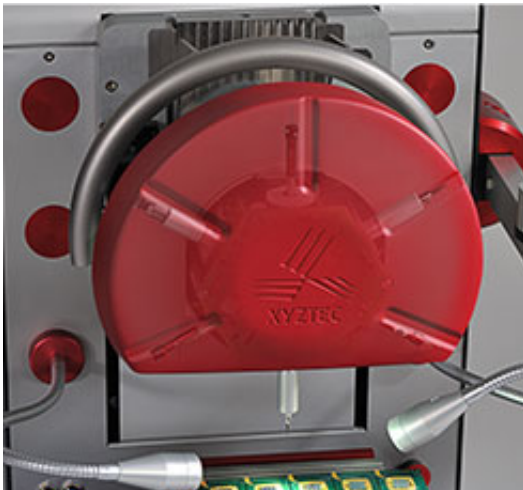
Six sensors RMU, up to 200 kgf: changing cartridges manually no longer required

Компания XYZTEC являясь мировым лидером в тестировании соединений быстро и успешно развивается на территории России. Одной из причин нашего успеха является то, что продажей и сервисным обслуживанием как в местном так и в международном масштабе помимо нас занимаются также наши партнеры. Запасные засти можно заказать у местных представителей, что гарантирует быстрое решение проблем заказчиков.