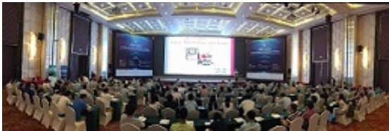
Increase your knowledge about bond testing at a bond testing seminar

The Revolving Measurement Unit (RMU) enables continuous operation with up to six different test types on the one machine at forces up to 200kgf. Additionally, you can also choose for dedicated systems. XYZTEC is also unique in its high force products and next generation tweezers.