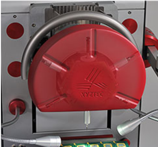
Six sensors RMU, up to 200 kgf: changing cartridges manually no longer required

Компания XYZTEC являясь мировым лидером в тестировании соединений быстро и успешно развивается на территории России. Одной из причин нашего успеха является то, что продажей и сервисным обслуживанием как в местном так и в международном масштабе помимо нас занимаются также наши партнеры. Запасные засти можно заказать у местных представителей, что гарантирует быстрое решение проблем заказчиков.