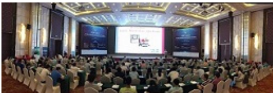
Increase your knowledge about bond testing at a bond testing seminar

The Revolving Measurement Unit (RMU) enables continuous operation with up to six different test types on the one machine at forces up to 200kgf. Additionally, you can also choose for dedicated systems. XYZTEC is also unique in its high force products and next generation tweezers.