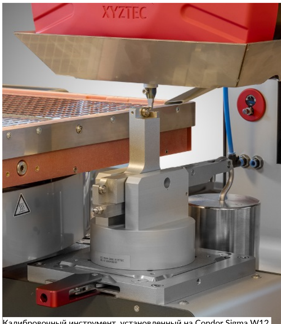
Калибровочный инструмент, установленный на Condor Sigma W12