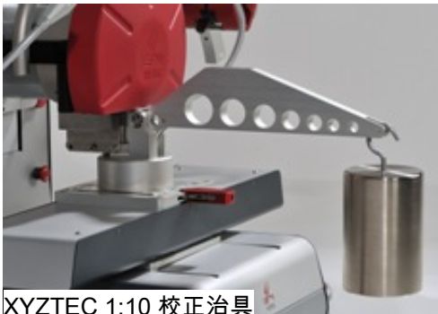
XYZTEC 1:10 校正治具

所有 XYZTEC 的傳感器模塊都已被完整測試及校正,隨時可以使用。 每一個傳感器都擁有各自的電子電路模塊,可以同時儲存所有測力和溫度校正資料。 也可以儲存其它資訊像是,傳感器型號,測力範圍, S/N 製造號碼,等資料。